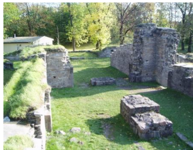
Klosterruiner i dag.