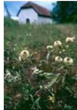
Tre eksemplarer av bakkekløver

*Truede arter blir registrert i nasjonale rødlister som stadig oppdateres.