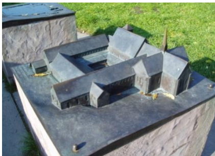
Modell av klosteret slik det så ut på slutten av 1200 tallet.

I januar 1532 plyndret og brente han klosteret og tok alle verdifulle gjenstander med til Akershus.